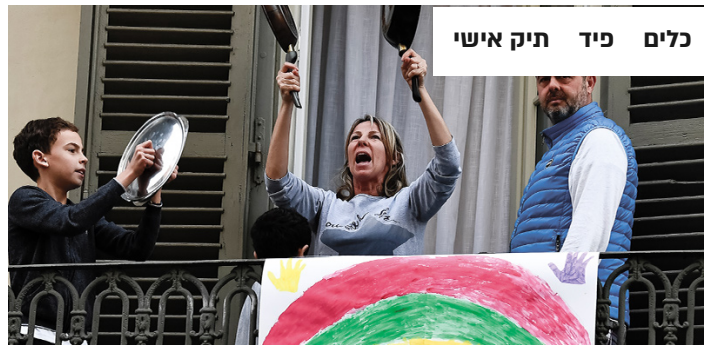
כלים פיד תיק אישי

משפחה איטלקית מאלתרת עם כלי בית נגינה ביחד